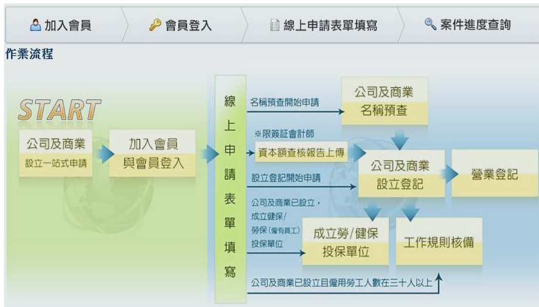
圖 3 公司及商業設立一站式線上申請作業網站作業流程