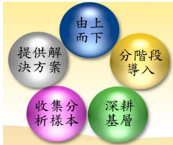
圖一 宜蘭縣政府導入 ODF 策略