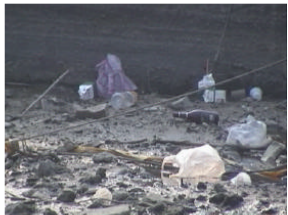
圖二 塑膠袋堆積於河岸之情形