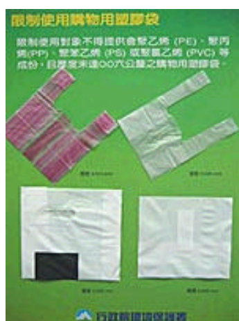
圖三 限制使用之購物用塑膠袋

凡屬限制使用對象未依前述規定辦理者，依廢棄物清理法第五十一條規定，可處新台幣六萬元以上三十萬元以下罰鍰。