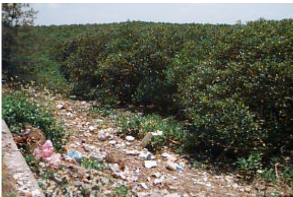
圖一 紅樹林遭塑膠污染情形

依據國內經驗，塑膠在環境中流布，常導致排水溝渠之阻塞，因排水不良而引發之水災，時有所聞，對生命財產產生危害，而塑膠袋及塑膠類免洗餐具於河川中漂流後，部分堆積於河岸、海岸及潮間帶之紅樹林等區域，亦造成生態環境之破壞。台灣地區目前垃圾處理方式有五成為焚化處理，而部分塑膠材質（如 PVC、PS 等）以焚化方式處理可能導致戴奧辛之產生，且塑膠材質高熱值之特性，亦對部分焚化爐之操作產生負面影響。另塑膠袋漂浮於海面上易被海洋生物誤食，而造成海洋生態之破壞。