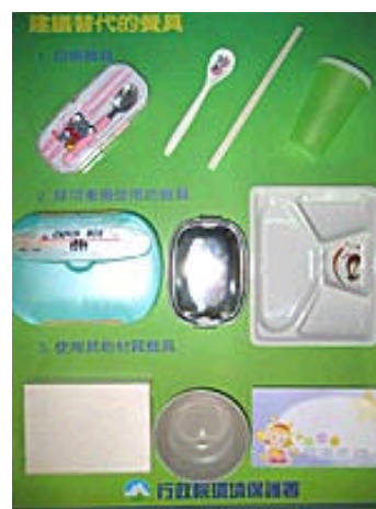
圖六 建議採用之餐具