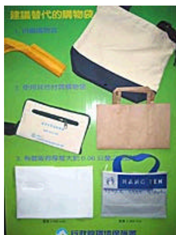
圖五 建議採用之塑膠袋

至塑膠類（含保麗龍）限制使用政策實施後，可採取之配套措施包括：若具規模可設置餐具清洗及滅菌設備者，可改採用可重複清洗使用之餐具；或可採促銷或優惠方式鼓勵民眾自備餐具，或改採其他材質之替代餐具（如紙餐具）。