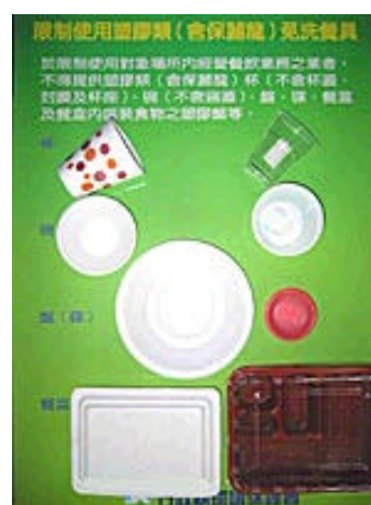
圖四 限制使用之塑膠類免洗餐具