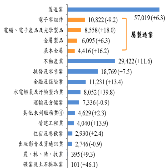
111 年 5 月底全體銀行對公民營企業放款餘額按借戶行業別 (億元)

三、製造業以電腦、電子產品及光學製品業放款餘額增最多：若就製造業中業別觀察，對電子零組件業放款餘額最高(占製造業 19.0%)，惟年減 9.2%；對電腦、電子產品及光學製品業放款餘額較上年同月底增 1,308 億元(+18.0%)增最多；其他放款較多之業別包括金屬製品業與基本金屬業等，分別增 6.3%及 16.2%。