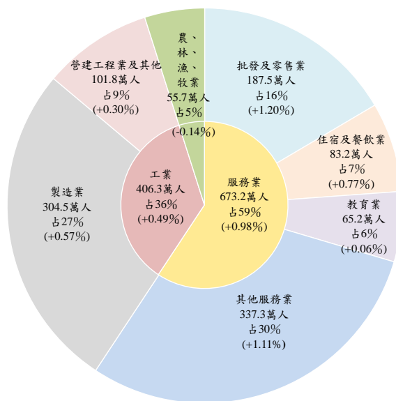
106 年平均就業人數—按行業分

三、按就業人數觀察，106 年平均就業人數 1,135.2 萬人，較 105 年增 8.5 萬人 (+0.75%)，其中 45-64 歲增 5.2 萬人最多，15-24 歲及 65 歲以上則各增 1.7 萬人及 1.4 萬人。就各行業人數觀察，服務業占 59%，年增 6.5 萬人 (+0.98%)，工業占 36%，年增 2 萬人 (+0.49%)；與 105 年相較，增加較多行業主要是批發及零售業，增 2.2 萬人、製造業亦增 1.7 萬人，住宿及餐飲業及支援服務業則各增 6 千人。