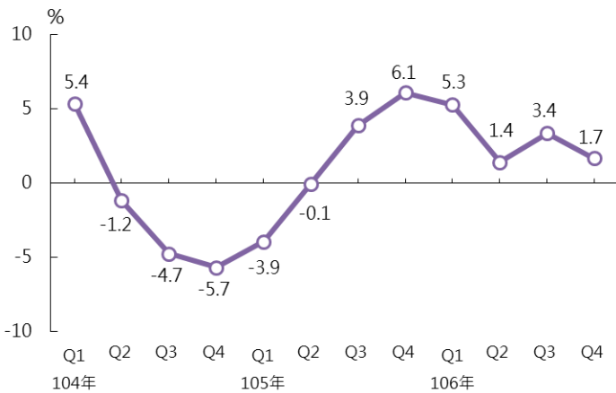
工業生產指數年增率