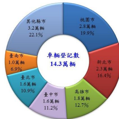
107 年 6 月底電動機車登記數-按縣市別

三、另依經濟部統計，106 年國內銷售(含間接外銷)電動機車平均每輛單價為 6 萬 8,475 元，較上年跌 13.0%，今年 1-4 月平均銷售單價再跌 19.1%，降至 6 萬 5,752 元，價格下降亦有助於推升電動機車普及率。